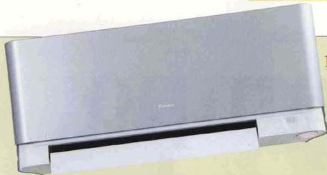
1 Daikin Emura