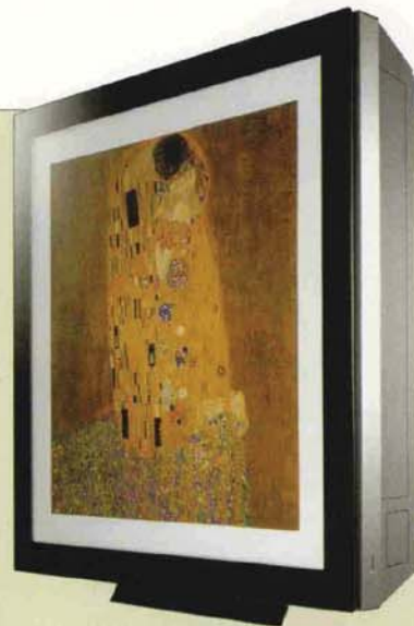
2 LG Art Cool